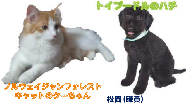
ノルウェイジャンフォレスト キヤットのクーちゃん