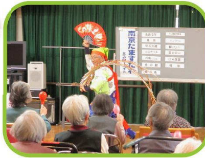
ミスターエイト来苑 4月27日(木)

外出、ミスターエイト、 寿司バイキング それぞれ、利用者様楽しんで おられました。(=・^=) 笑顔が見られて良かったです♪