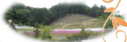
さくらグループ外出 5月9日(火)

晴れを願っていましたが 天候が悪く残念(;>_<) 夢前の芝桜を見に行きました。 その帰りにヤマサの かまぼこを買って「美味しい」 と喜ばれていました。