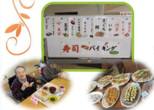
寿司バイキング 3月22日(水)

お寿司はみ～んな美味しく いただきました。 どのお寿司が 一番人気だったかな?? サーモン・マグロ・カンパチ どのネタも美味しかったと 好評でした。☆三