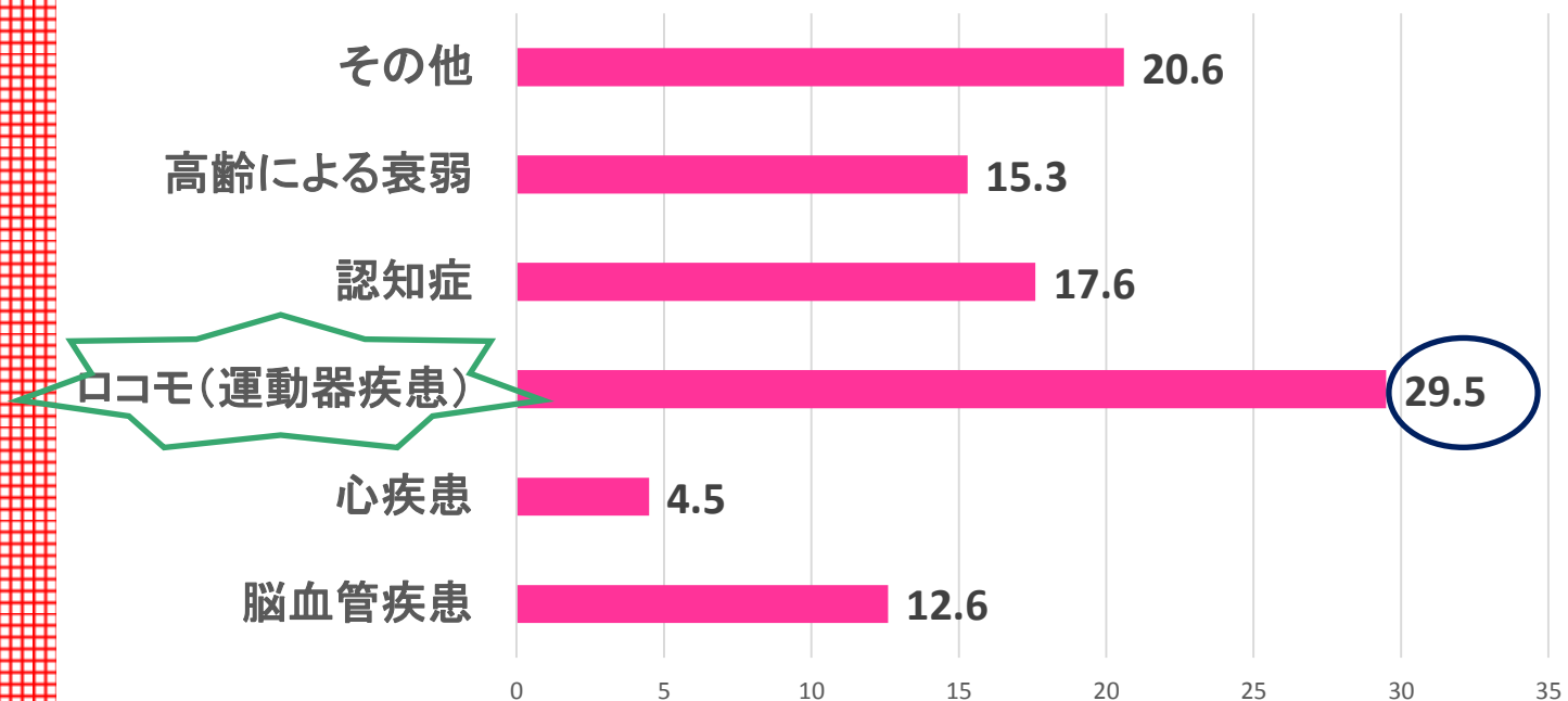
要介護の原因(65歳以上女性)厚労省H25年国民生活基礎調査(%)

女性(65歳以上)の要介護の原因第1位は『ロコモ』です。すなわち関節・筋肉・骨など運動器の障害によって要介護状態となります。女性は男性に比べ、筋肉量が少なかったり、骨粗鬆症や変形性関節症などが多いのがその理由です。